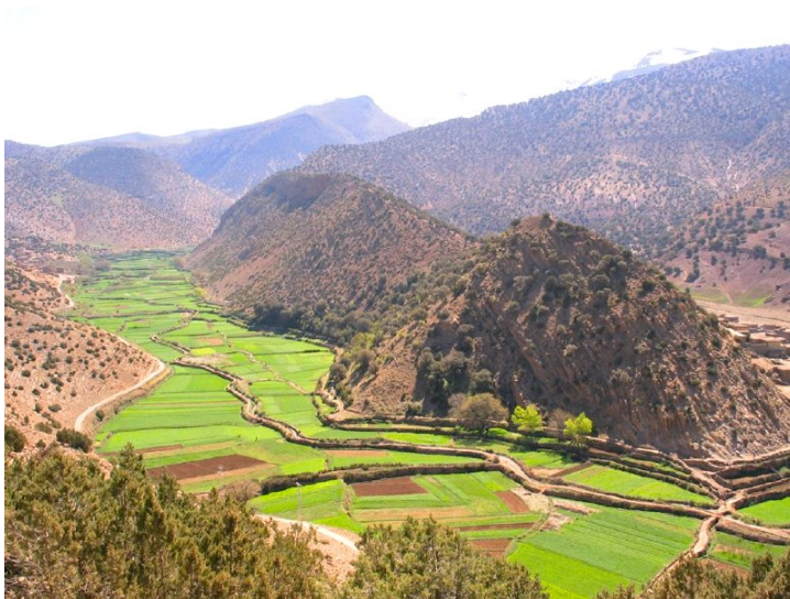
La vallée de Aït Bouguemez dans le Moyen Atlas central.

bleue sur un tapis vert. Là-dessus, de-ci, de-là, les châteaux surgissent comme écus du Tibet ou boucliers d'antilope, comme astre au zénith de leur fulguration, entre les terres des domaines, tirées au cordeau [ muqawama bil-stiwa ] et auxquelles l'extrême industrie des hommes prête l'apparence rigoureuse d'un miroir. » (Miquel, 1980, p.89 cité par L. Latiri, 2008.).