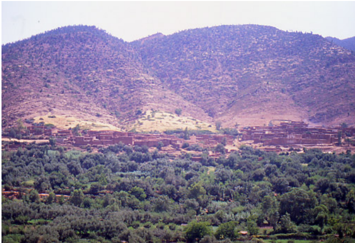
Un village dans la vallée de l'Ourika.